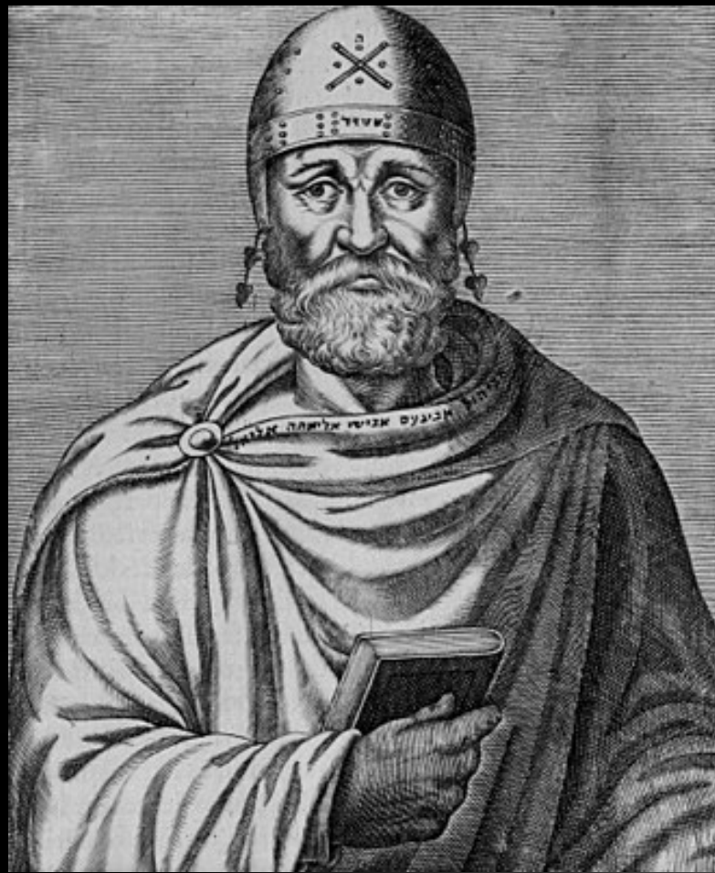
Filón de Alejandría (15 a.C. – 45 d.C.) Filósofo judío del primer siglo